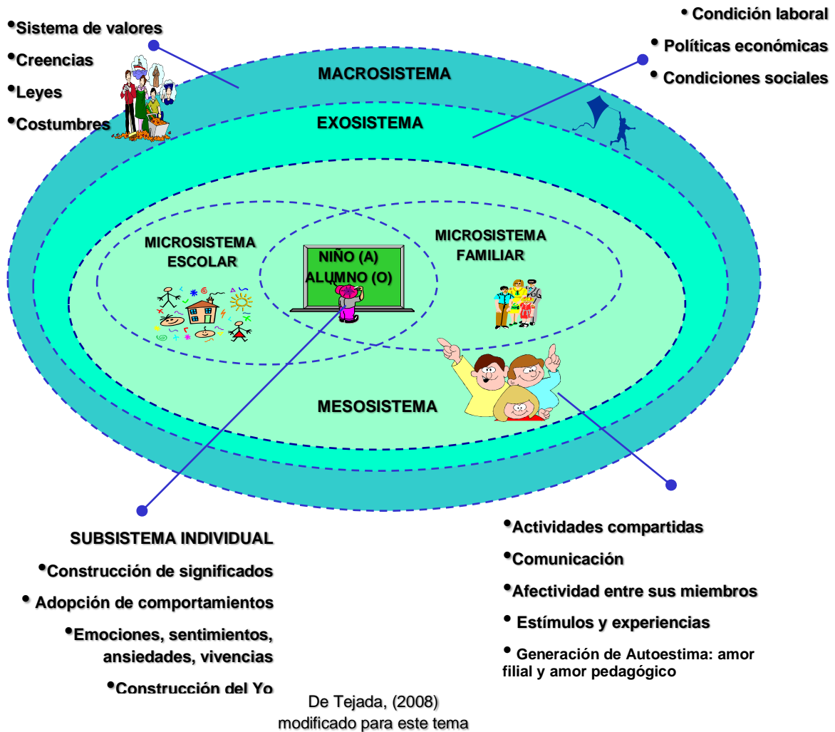
Gráfico 1 El enfoque ecológico del desarrollo humano

En síntesis, a lo largo del ciclo vital, la influencia de la herencia o del ambiente depende de la etapa evolutiva en que se encuentre el individuo. Puede afirmarse que los seres humanos somos más parecidos los unos a los otros mientras más pequeños somos, porque en las primeras etapas de la vida el contenido cerrado del código genético toma su protagonismo, pero a medida que avanzamos en el ciclo vital, la batuta del desarrollo es más dirigida por el ambiente con su organización contextual y cultural, tal como lo plantea Bronfenbrenner (1987), en su Enfoque Ecológico del desarrollo humano.